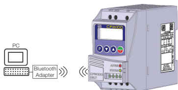
Figure A2: Communication with the SuperDrive G2