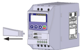
(a) Removal of the communication accessory cover (a) Remoción de la tapa de accesorios de comunicación (a) Remoção da tampa de acessórios de comunicação