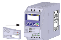
(b) Accessory connection (b) Conexión del accesorio (b) Conexão do acessório